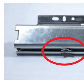
収納保持機能も備えた3533Cモデルも対応可能です。