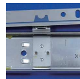
簡単に脱着できます。