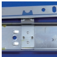
収納保持機能も備えた3533C モデルも対応可能です。簡単に脱着できます。