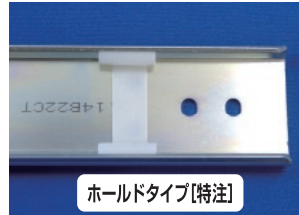
ホールドタイプ[特注]

・部品番号①②：電気亜鉛めっき（三価光沢クロメート） 但し、U21はステンレス製のため生地のままです。